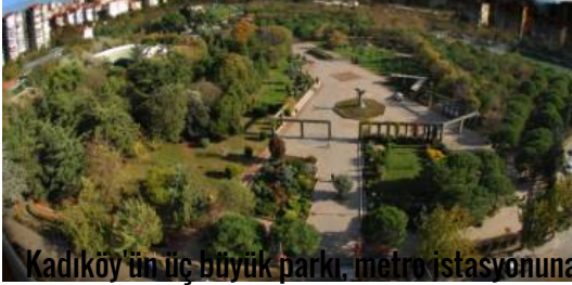
Kadıköy'ün üç büyük parkı metro istasyonuna dönüşüyor

( https://www.emlakwebtv.com/basaksehir-park-mavera-2-etap/54579 )