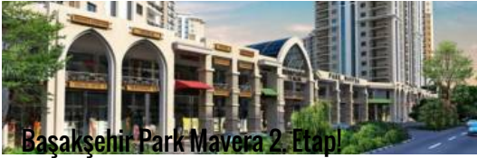
Başakşehir Park Mavera 2 Etapı

( https://www.emlakwebtv.com/basaksehir-park-mavera-2-etap/54579 )