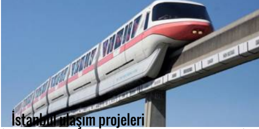
İstanbul ulaşım projeleri

( https://www.emlakwebtv.com/kadikoyun-uc-buyuk-parki-metro-istasyonuna-donusuyor/54578 )